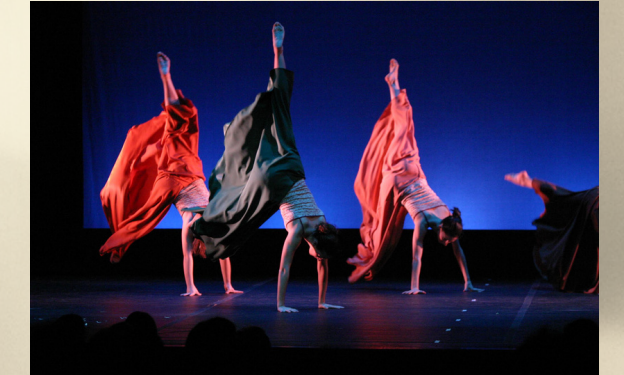
"De genios y de locos"