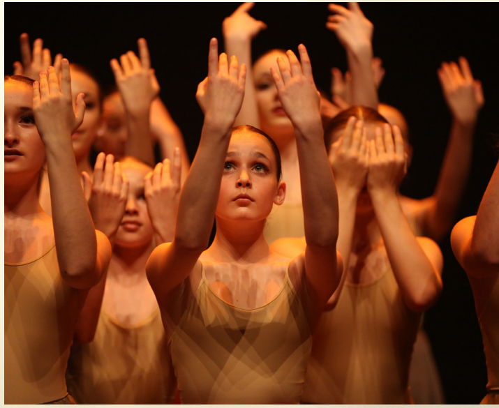
Cia. convidada al Forum Impulsa, actuant per als Prínceps de Girona