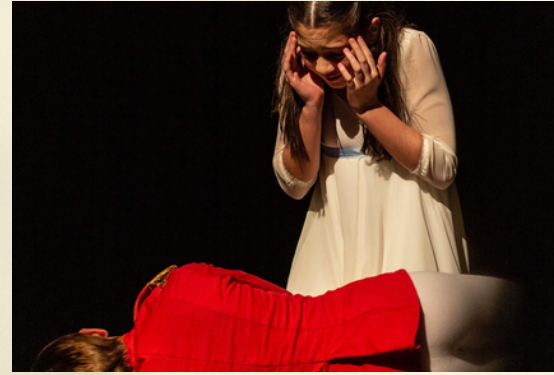
"Clara volía ser gran"