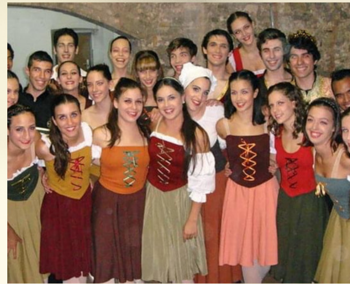
"Romeo i Julieta" en col·laboració amb la Jove Orquestra del Vallès