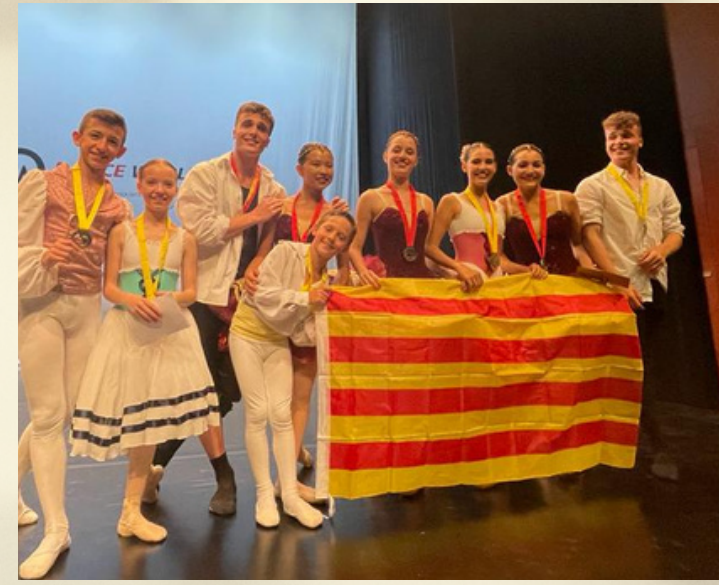
Participació i nombrosos premis en 9 Finals Mundials YAGP a Nova York