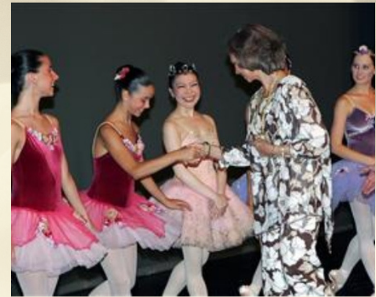
Actuació per a Sa Majestat la Reina Sofía