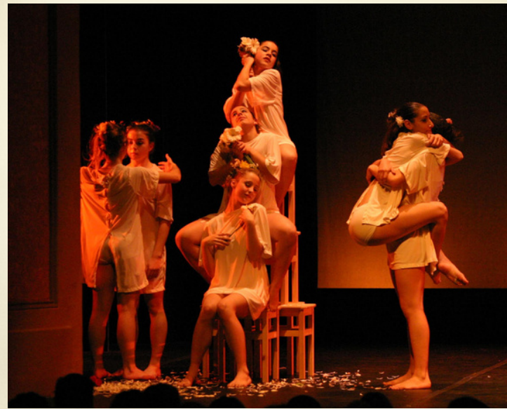
Companyia convidada com a referent a "La casa de la danza" (Haro)