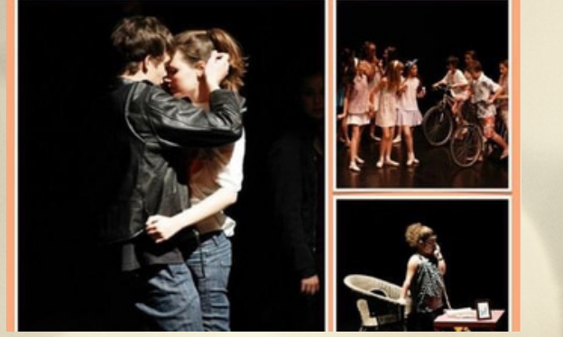
"Jo vaig néixer als 70"