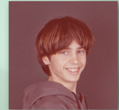
Ot Marién Actor

També ha participat en taller d'improvisacions i creació de personatges per definir l'obra teatral Vota Lola , i ha pres part en el curt cinematogràfic La cultura segura