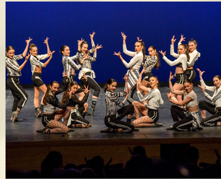
Participació en programes de TV com "Prodigios", "Got Talent" i "Tu si que vales"