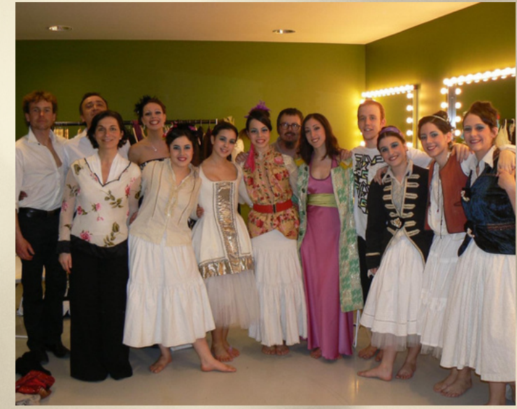
Cia. convidada a La Llotja de Lleida per a l'inauguració del festival de cinema fantàstic