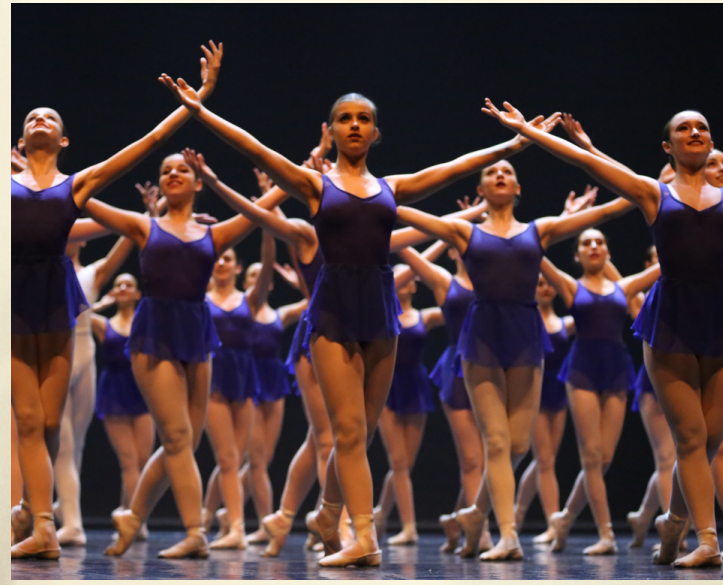
Col·laboració, intercanvi i espectacle conjunt amb la Cia. Italiana "Il Balletto"