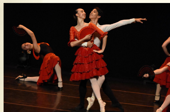
"Suite El Quijote"