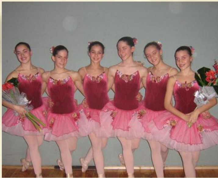
Gira "Le Corsaire" amb Angel Corella & Friends from ABT